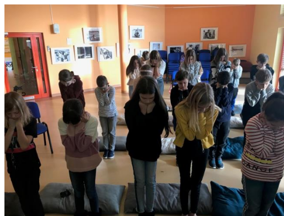
Poznajemy zasady bezpieczeństwa