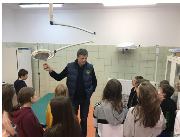
Sala operacyjno-zabiegowa w schronisku