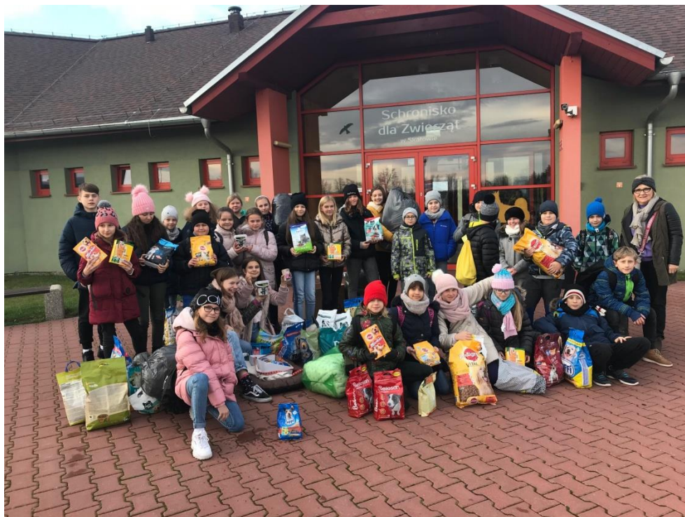
Wolontariusze z SP2 w Zalasewie z wizytą w schronisku