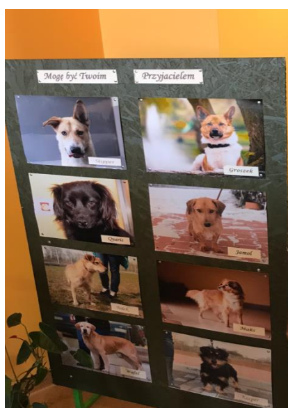
Niezwykłe historie psów