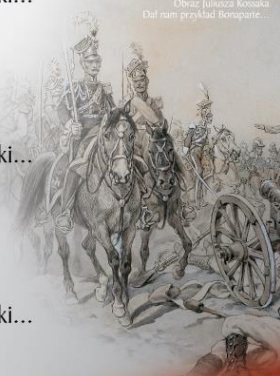
Obraz Juliusza Kossaka Dał nam przykład Bonaparte...