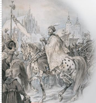
Obraz Juliusza Kossaka Jak Czarniecki do Poznania...