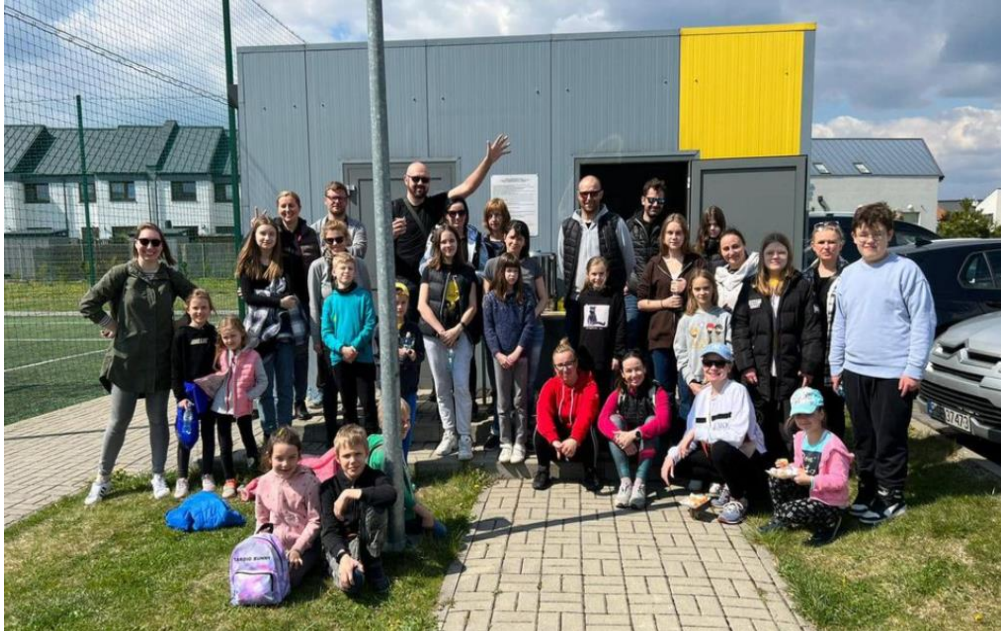
2 Edycja „Sprzątanie Świata”